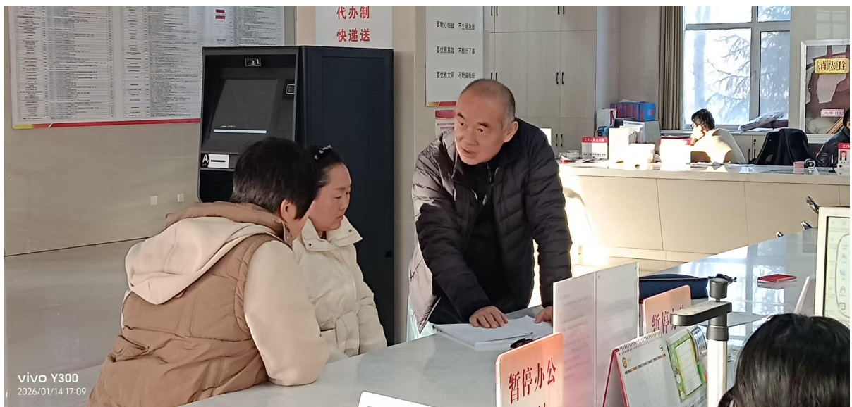
李俊镇便民服务中心