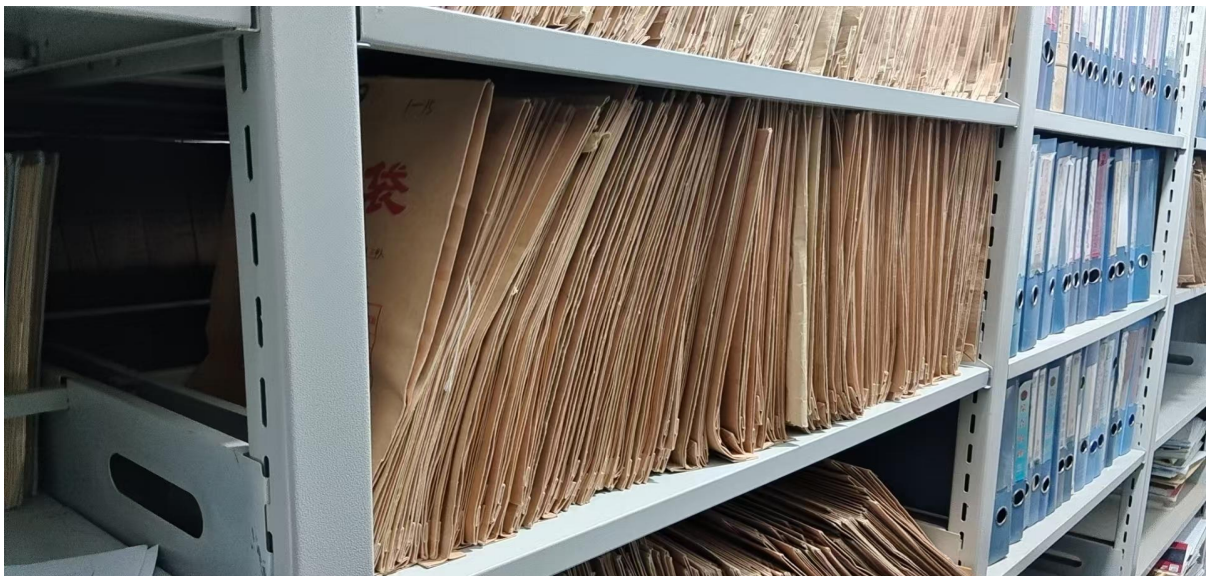
望洪镇便民服务中心