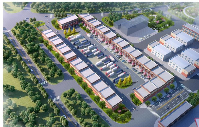
闽宁恒通现代物流园项目一鸟瞰图