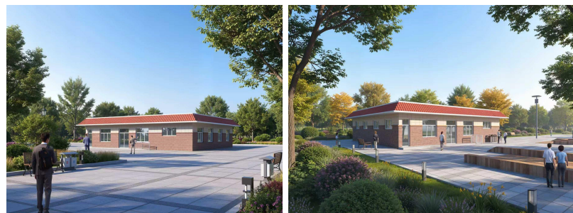
6#辅助用房外立面效果图