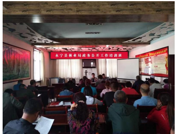
图1.5 组织政务公开工作培训

（五）狠抓落实，成功举办“政府开放日”活动。 为深入贯彻党的十九大精神和习近平新时代中国特色社会主义思想，加快推进阳光、透明、开放、服务型政府建设，切实保障人民群众的知情权、表达权、参与权和监督权，进一步提升政务公开工作水平，按照县人民政府安排部署，结合工作实际，永宁县林业局于10月31日下午开展2018年“政府开放日”活动。邀请人大代表、政协委员、群众代表、服务对象、媒体记者等开放对象20余人，深入秋季植树造林现场，实地观摩我县造林绿化成效，并参观学习酒庄葡萄酒酿造、生产过程，最后召开座谈会，对公众普遍关注的林地审批、林木检疫、病虫害防治、葡萄管理等问题及提出的意见建议现场进行了回应与解答，听取各位代表、群众对永宁县林业局造林绿化及林木管护工作方面的意见建议。