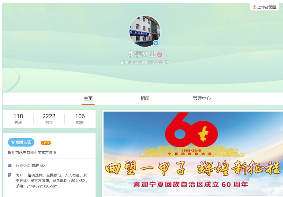
图 9.2 官方微博“永宁林业”