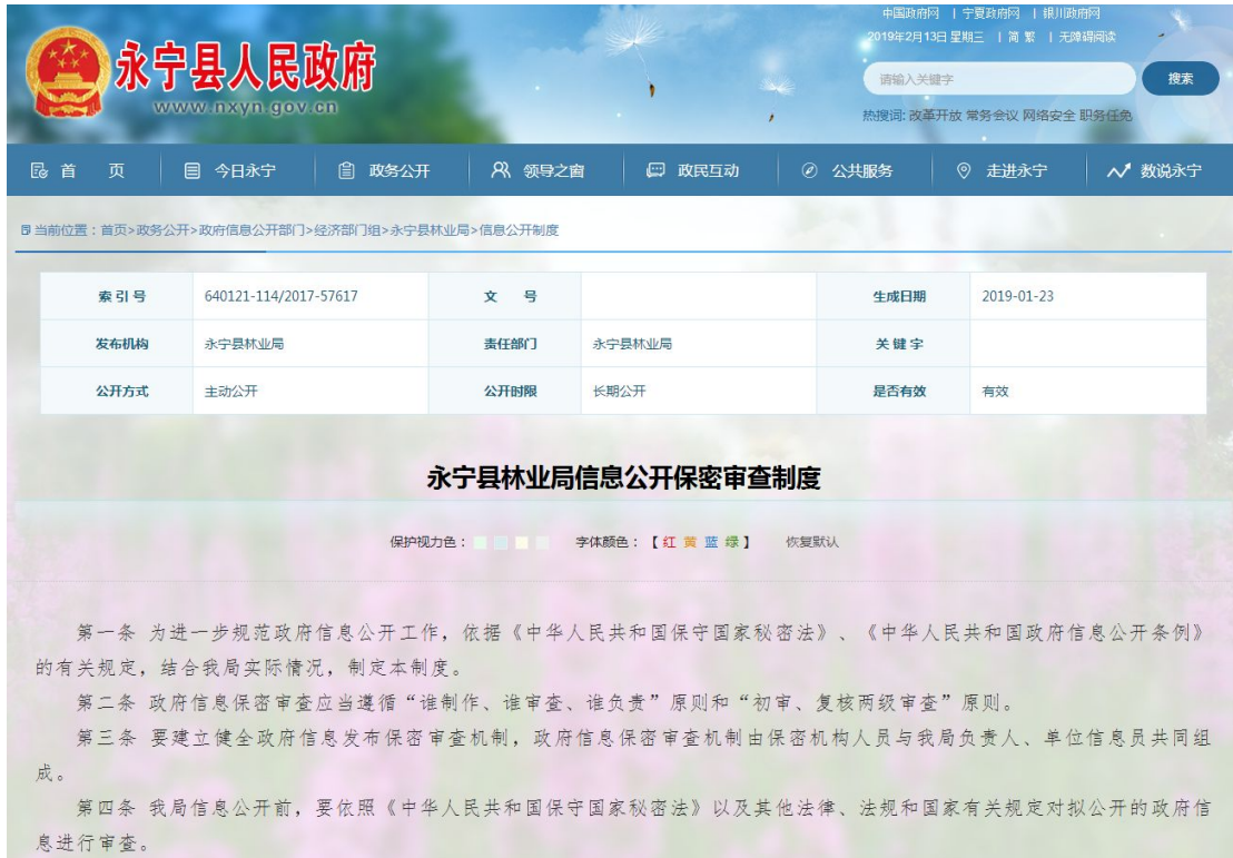
图 10.1 制定并发布信息公开保密审查制度