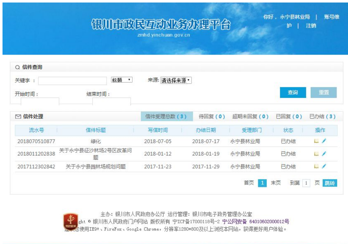
图 7.1 银川市民政互动业务办理平台来件办理