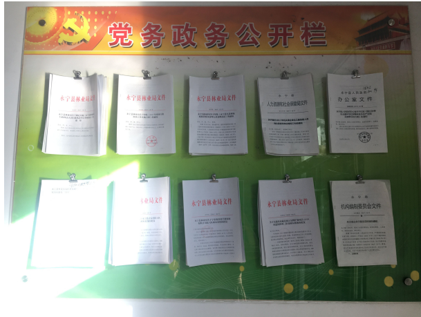
图1.4 开展政务公开工作宣传

达政务公开工作会议精神、学习政务公开相关文件，重点围绕行政决策公开、执行公开、管理公开、服务公开和结果公开方面及重点领域政务公开情况进行培训。