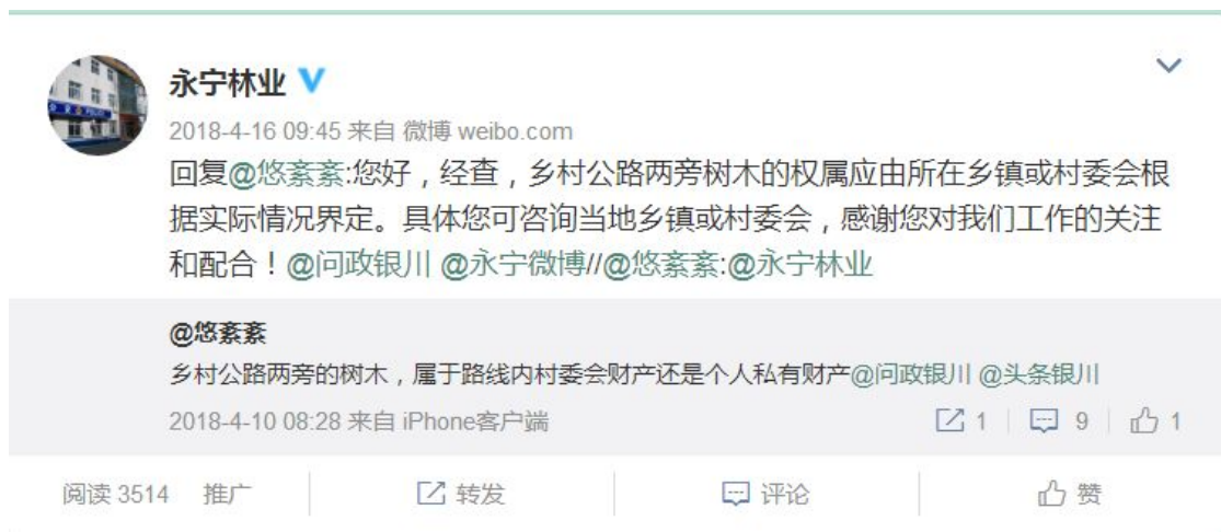
图 7.2 官方微博“永宁林业”市民咨询回复